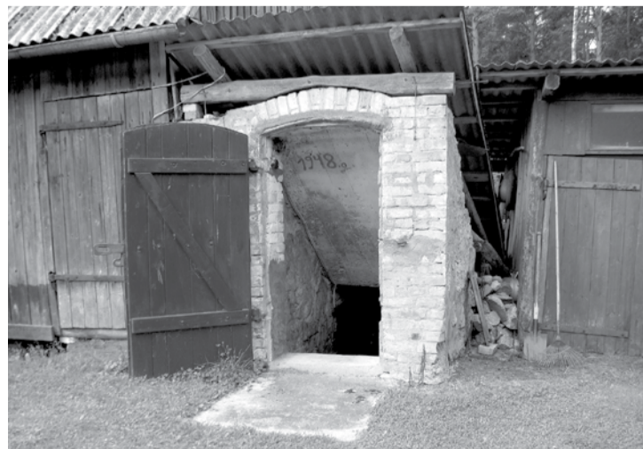
Владелец дома «Майлитес» получил специальный приз за сохранение исторической среды.

Заявку необходимо подать в течение 14 дней со дня опубликования объявления в газете „Latvijas Vēstnesis”.